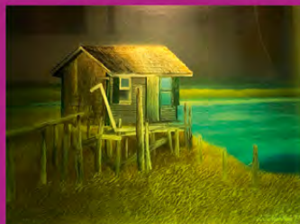
Leonhard Te Nyenhuis